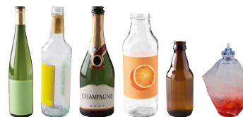
BOUTELLES ET FLACONS